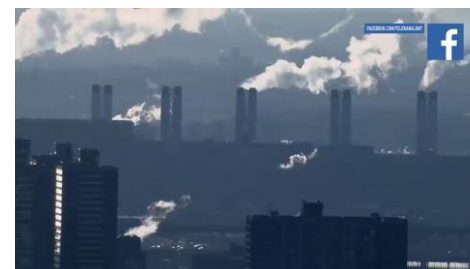
Видео «Как электроэнергию от солнечных батарей используют в Беларуси?» (03:17)

На начало 2021 года Лукомльская ГРЭС – самая мощная в Беларуси. В энергосистему страны от нее поступает около 30% электричества.