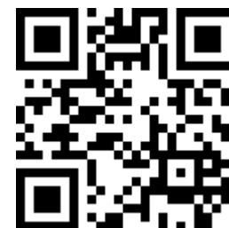
Видео «Витебская ГЭС» (03:38)